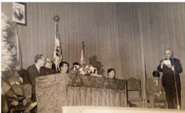
CERIMÓNIA DE INAUGURAÇÃO DO SALÃO PAROQUIAL